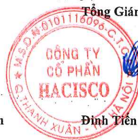
Đình Tiên Vịnh